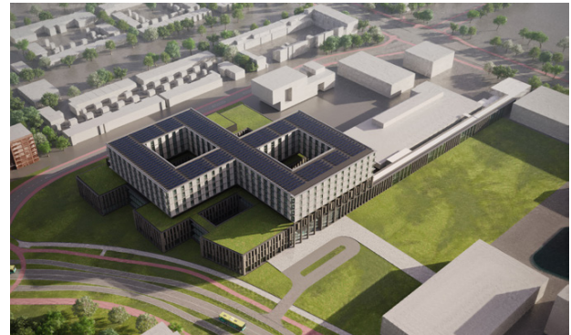
Dit wordt de vorm van het ziekenhuis