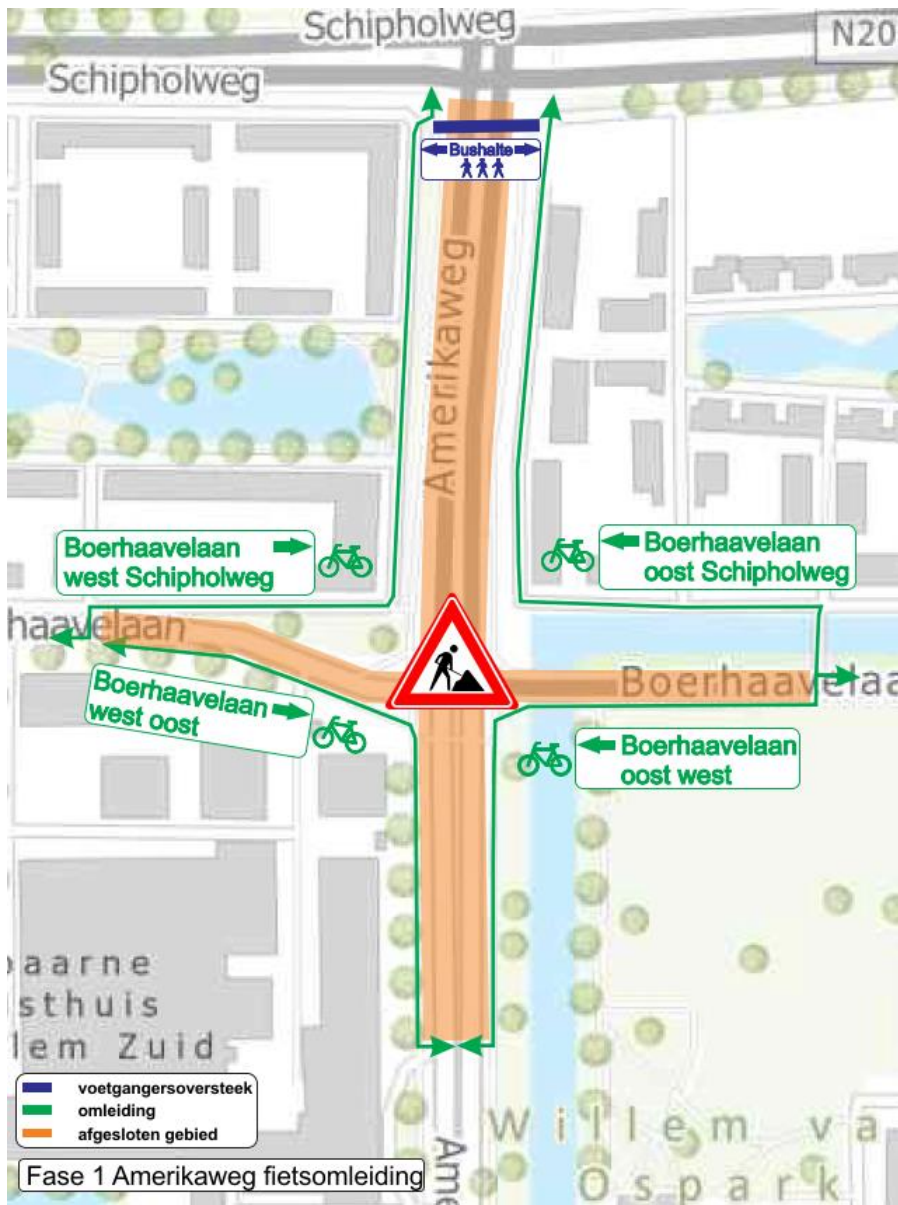
Figuur 2 Omleidingsroute fiets- en voetgangersverkeer