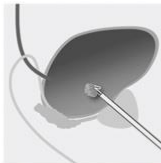
Weefsel verwijderen uit de blaas