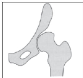
Heupdysplasie; de kop, de kom of beide zijn slecht gevormd.