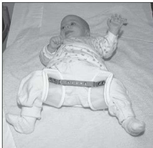
Baby in spreidbroek.

De polikliniekmedewerker heeft voor u praktische tips voor de verzorging van uw baby in een spreidbroek op papier. De firma Orthowel, die de brace maakt, is 1 keer per week aanwezig