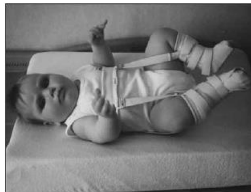
Baby in brace.