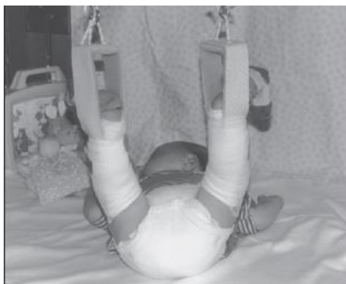
Baby in tractie.

Is de heupkop uit de kom (heupluxatie)? Dan wordt met een spreidbroek of een brace geprobeerd de heupkop weer op zijn plaats te krijgen. Dit noemt men reponeren. De spreidbroek of brace moet dan 3 weken, 24 uur per dag bij uw baby gebruikt worden. De ernst van de afwijking en de leeftijd van uw baby bepalen of deze behandeling mogelijk is.