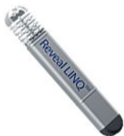
Reveal LINQ ( Medtronic)