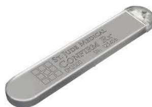
Confirm RX (Abbott)