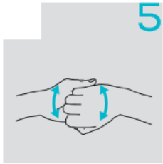
فرك مفاصل الأصابع براحة اليد