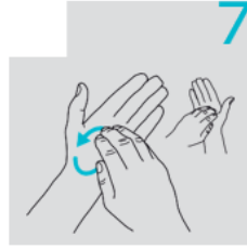
فرك أطراف أصابع اليد اليسرى واليمنى على راحة اليد وفي النهاية حول الرسغين