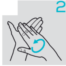
توزيع كحول اليد على اليدين والرسغين