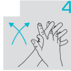
راحتي اليدين على بعضهما وما بين الأصابع