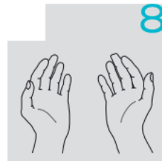
الاستمرار في الفرك حتى جفاف اليدين

بطاقة تعليمات النظافة هذه هي جزء من اجراءات عمل "نظافة اليدين".