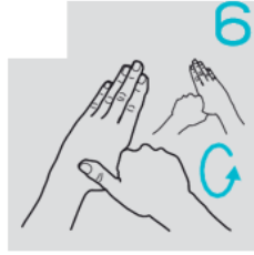
فرك الإبهامين اليسار واليمين