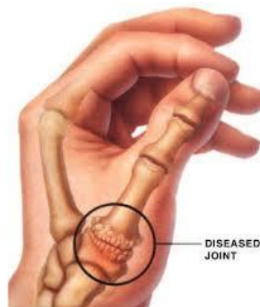
Artrose van de duimbasis

Voor de behandeling van duimbasisartrose wordt meestal eerst gekozen voor een behandeling zonder operatie.