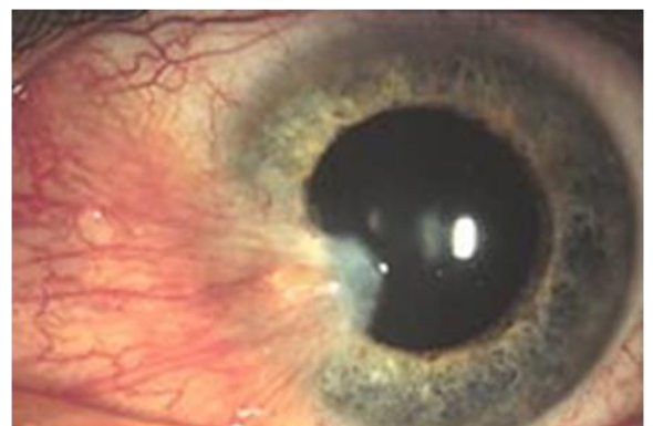
Figuur 1: Pterygium

Een pterygium komt vaker voor bij mensen die veel buiten hebben gewerkt. Een enkele keer is een pterygium een bijverschijnsel of gevolg van ontstekingen aan het hoornvlies en/of de harde oogrok (sclera).