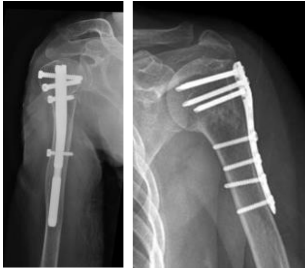
Plaat met schroeven in de bovenarm

Wij proberen u binnen 2 weken na het ontstaan van de breuk te opereren. Uw arts legt uit wat er precies tijdens de operatie bij u gaat gebeuren.