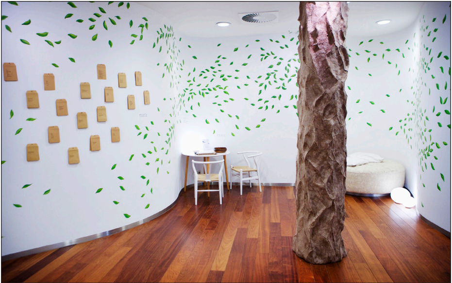
Het Stiltecentrum op de eerste etage, in de grote hal achter de winkel (volg route 41).