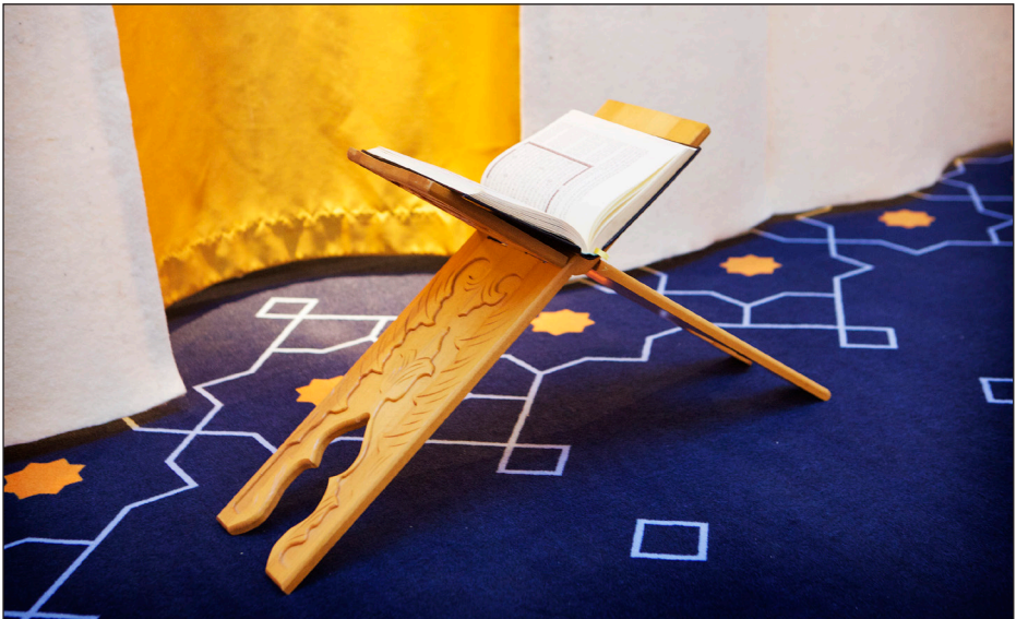
De Islamitische gebedsruimte op de begane grond (volg route 80). Deze gebedsruimte bestaat uit twee ruimtes, één voor mannen en één voor vrouwen, met gelegenheid voor de kleine wassing.