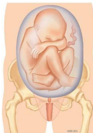
Volkomen stuitligging: De benen zijn gebogen. De voeten liggen bij de billen ("kleermakerszit").