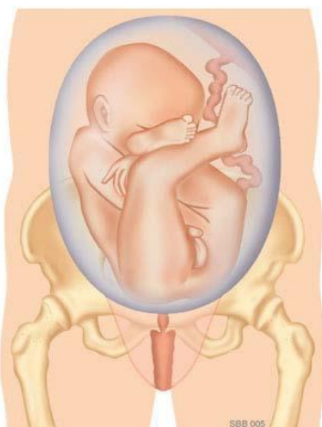
Onvolkomen stuitligging: De benen liggen omhoog naast het lichaam.